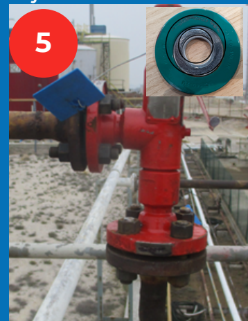
joint 3/4" au lieu de 1"