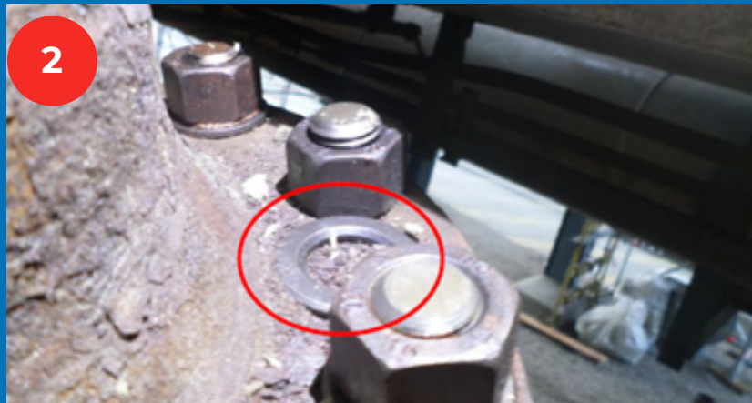
Absence de rondelle