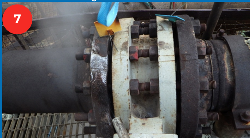
Les tiges filetées se touchent