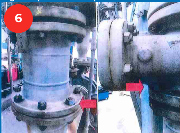
5 tiges trop courtes remplacées : 2 non-serrées