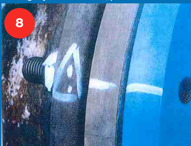
1 goujon mal monté, pris sur 2 filets