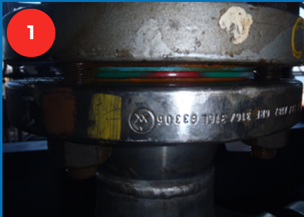
2 joints neufs l'un sur l'autre