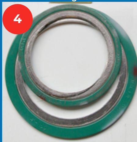
erreur de montage de diamètre